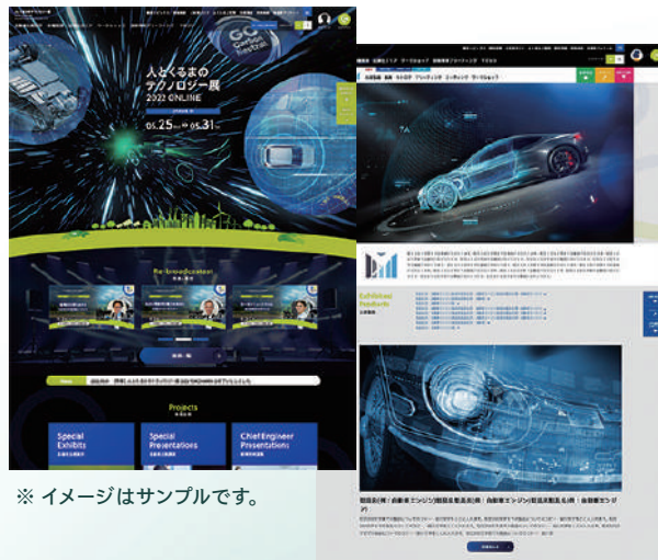
※イメージはサンプルです。